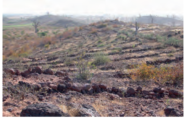
La zone dégradée en 2002, après la construction des cordons de pierre contre l'érosion

Une première zone protégée a été reboisée de 2002 à 2008 et protégée en tant que site pilote. En collaboration avec des organisations partenaires et la population locale, des mesures de développement écologique, social et économique de la région ont été mises en œuvre et les bases de la coopération ont été posées. D'autres projets ont été progressivement mis en place dans le domaine du développement durable, de l'agroécologie et de la formation.