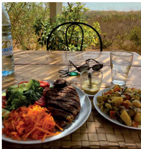
(1) L'intérieur d'une grande chambre (2) Le repas sur la terrasse