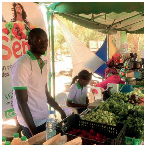
« SenBio » au marché