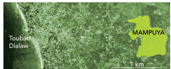
L'accès et la situation de MAMPUYA