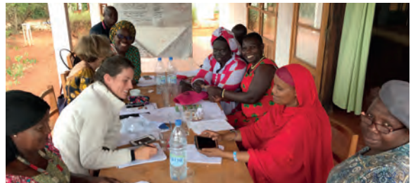
(3) La terrasse d'une chambre (4) La terrasse de salle à manger (5) La grande salle ouverte les 4 côtés (6) La terrasse de la salle de réunion